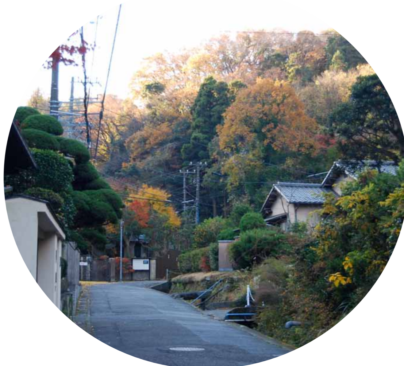
旧華頂宮邸へ続く道 12月