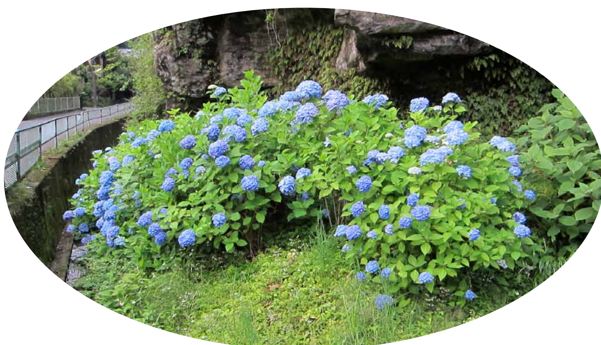
宅間ヶ谷のアジサイ 6月