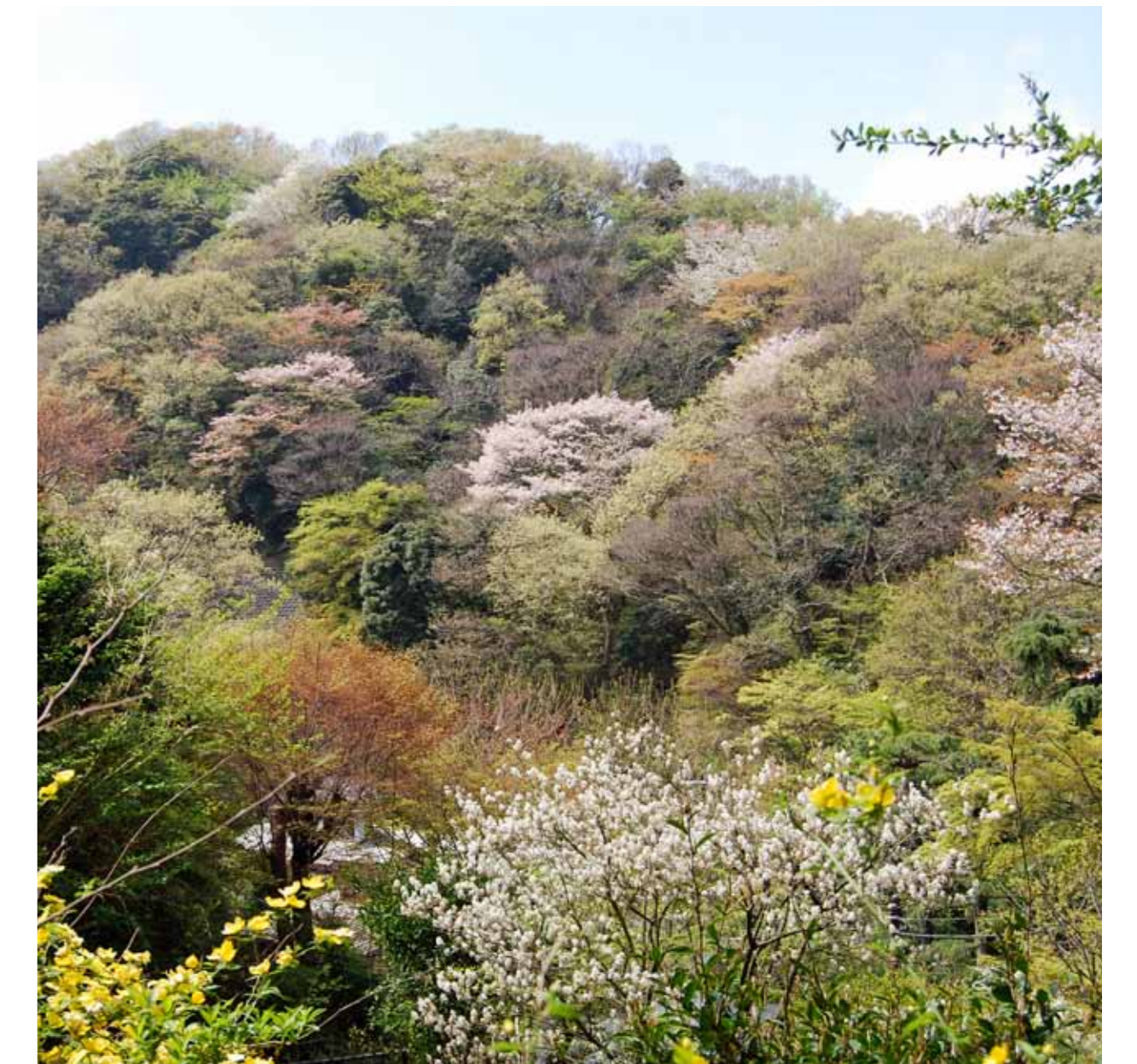
谷戸から衣張山方面を望む 4月