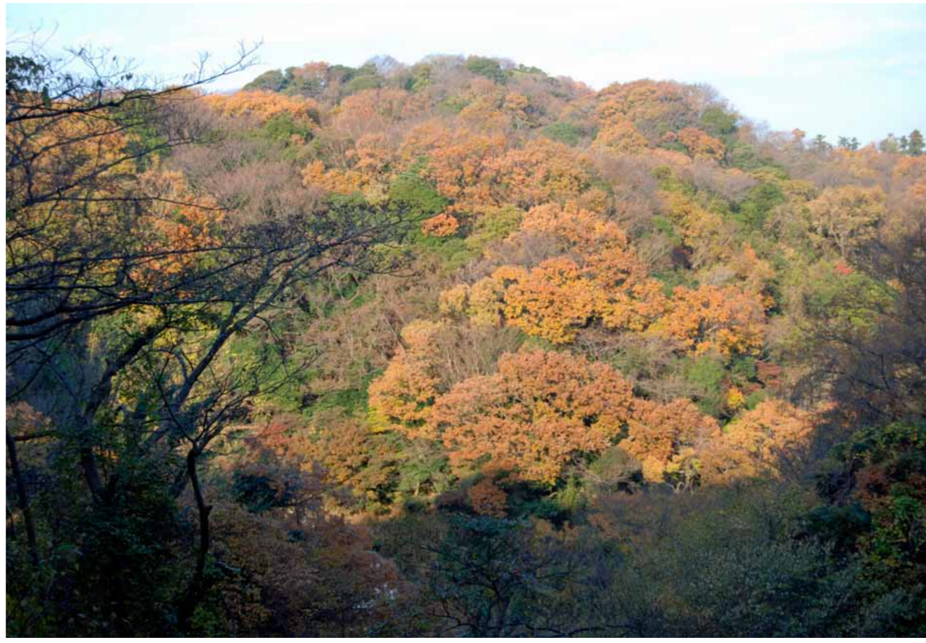
巡礼古道から衣張山を望む 12月