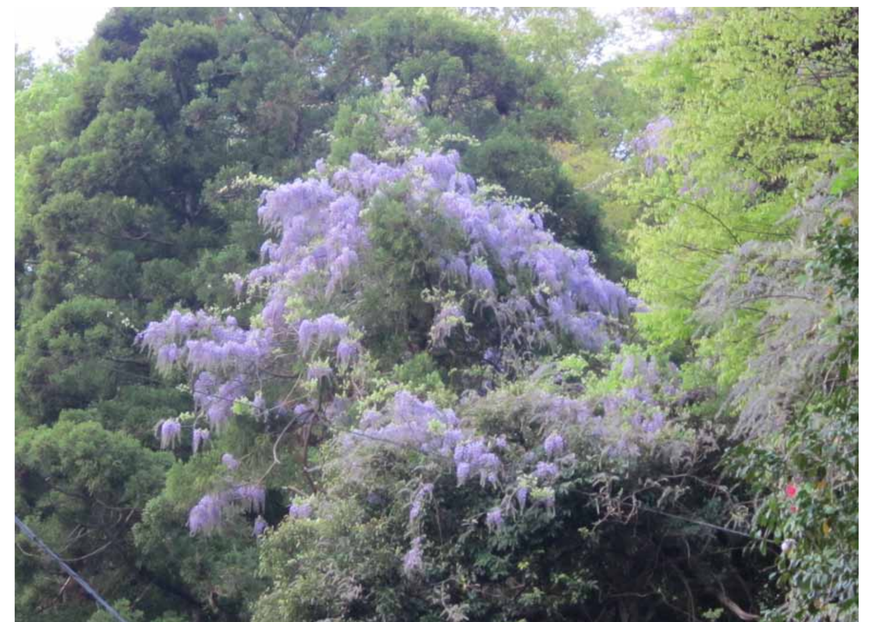
宅間ヶ谷のフジ 4月