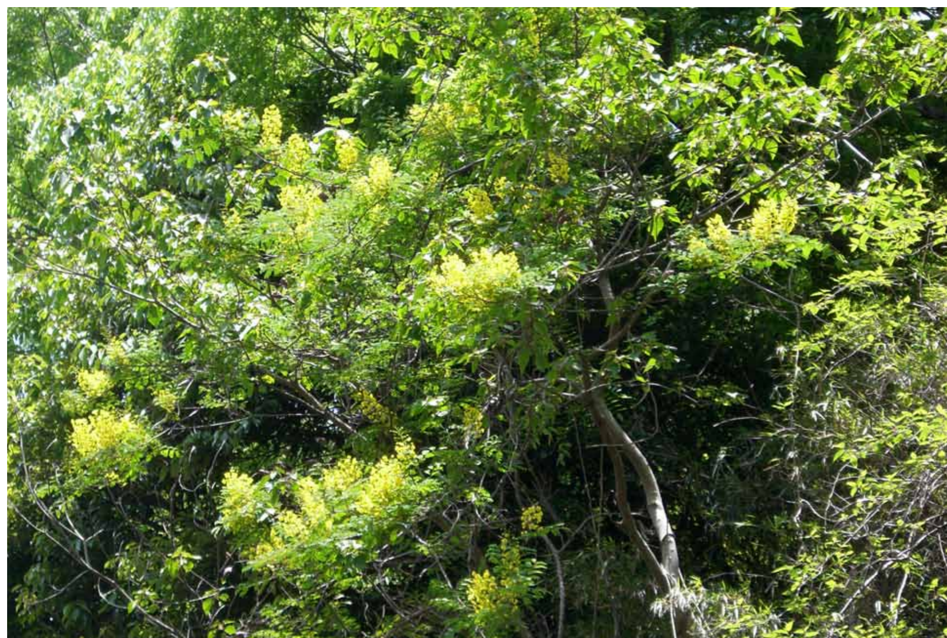
宅間ヶ谷のジャケツイバラ 5月