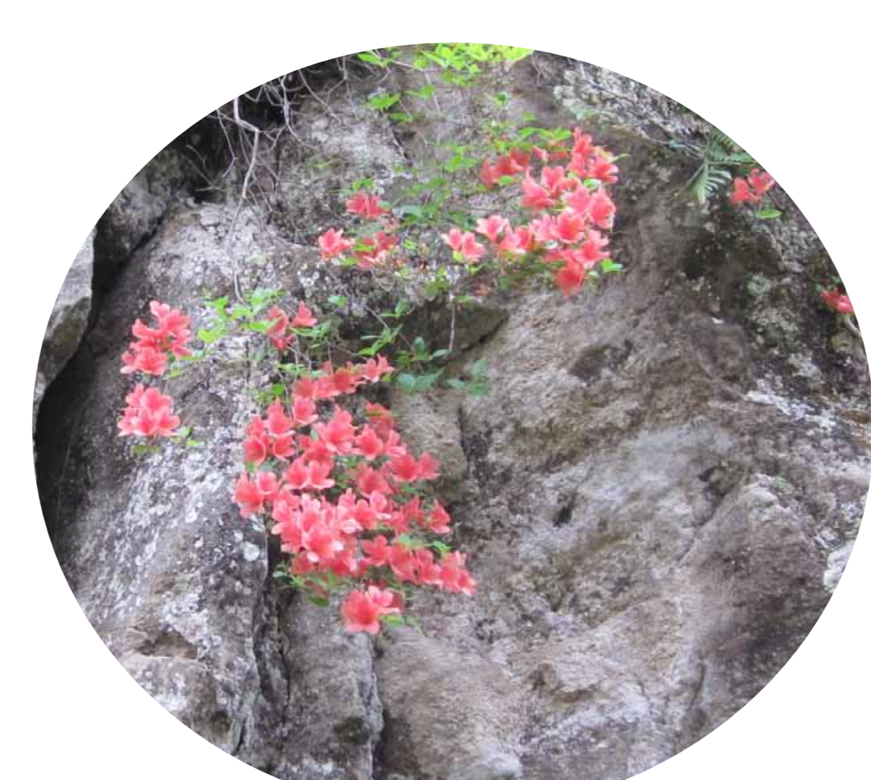
宅間ヶ谷のヤマツツジ 5月