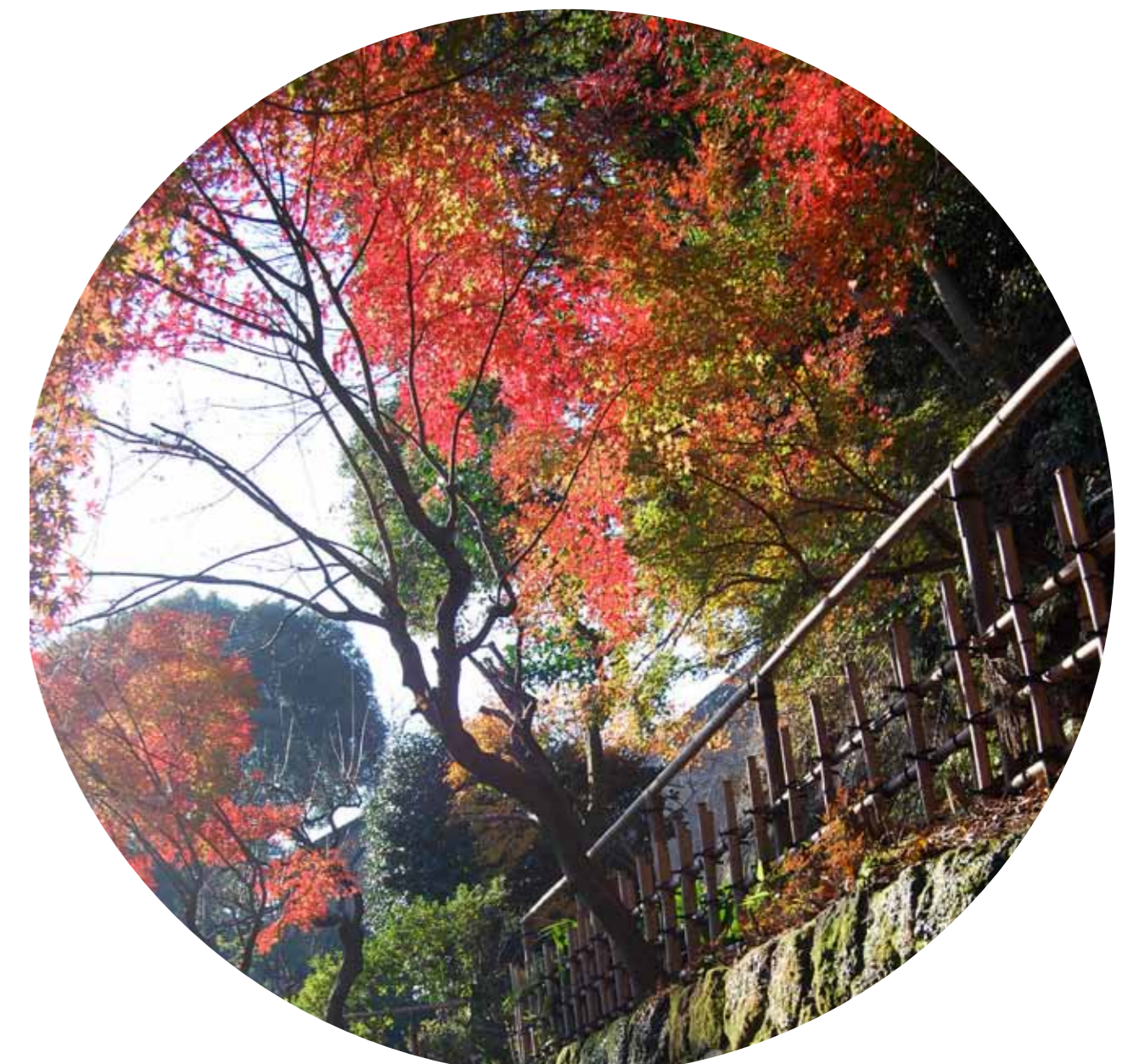
報国寺脇の紅葉 12月