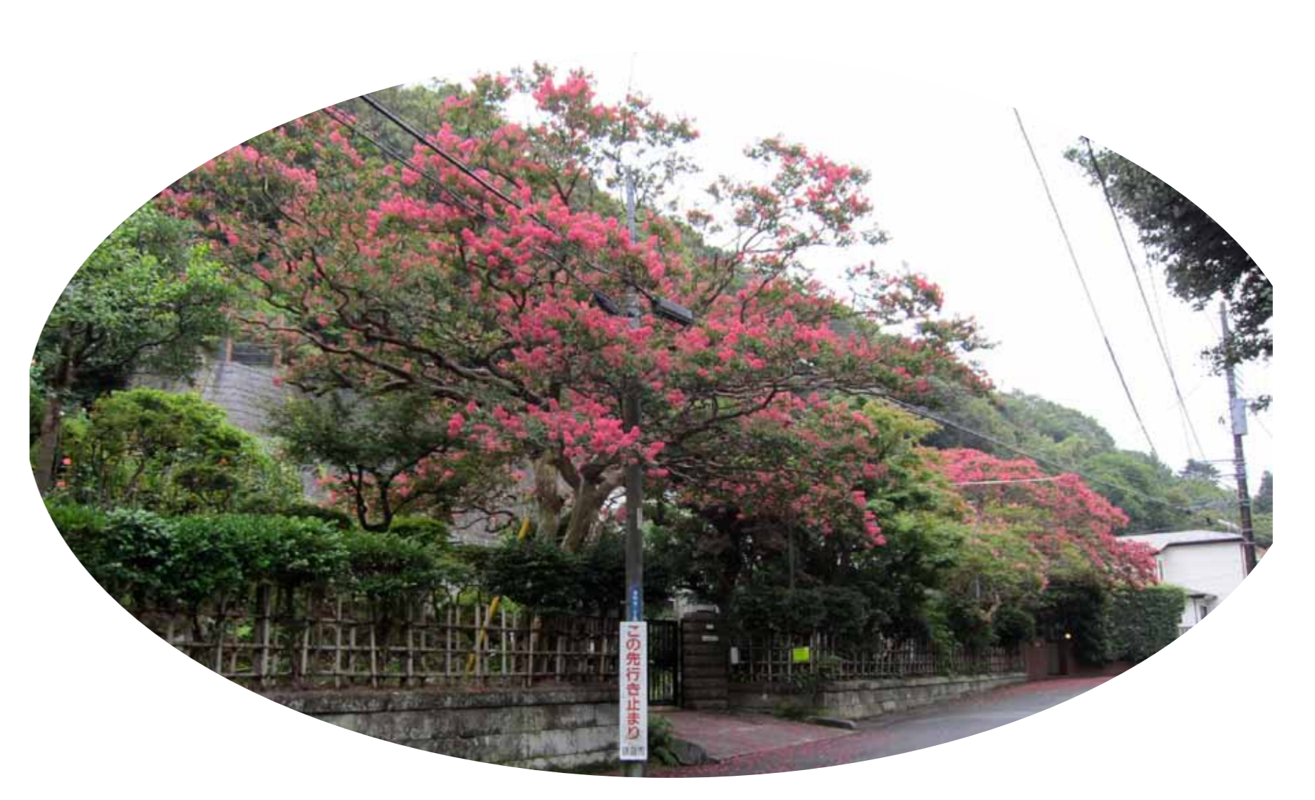
宅間ヶ谷のサルスベリ 8月