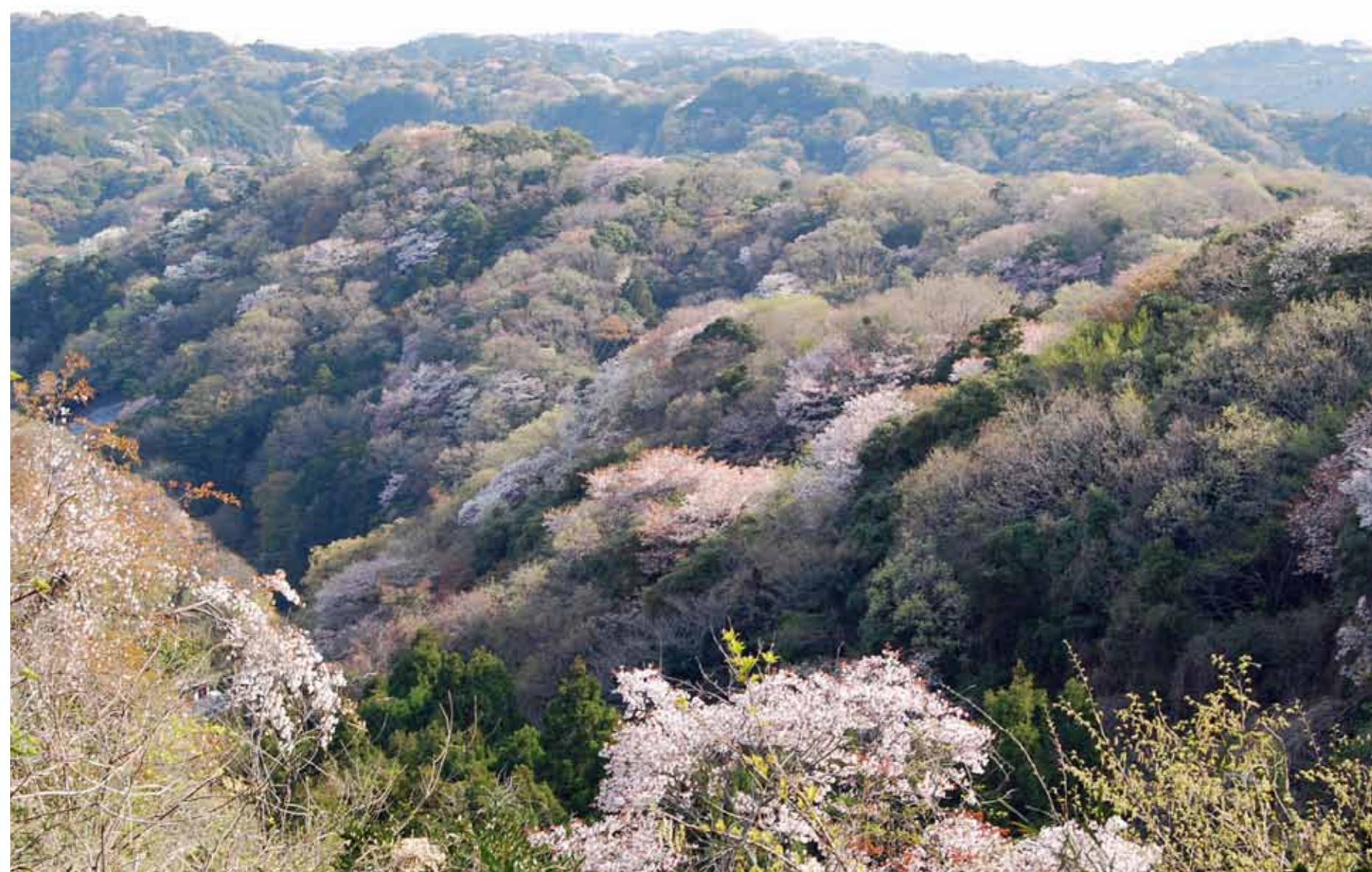
衣張山への道から宅間ヶ谷を望む 4月