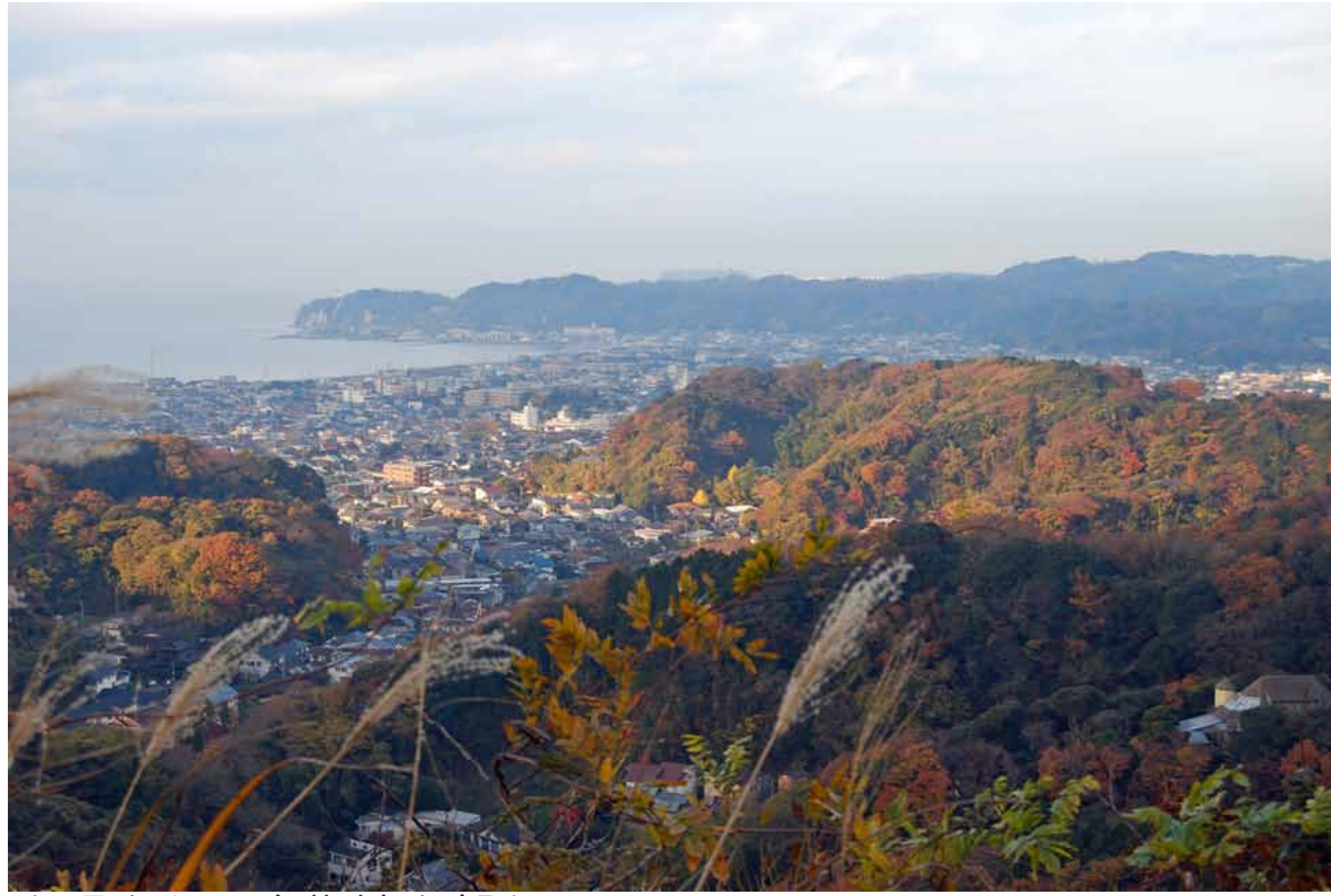
衣張山から市街地を望む 12月