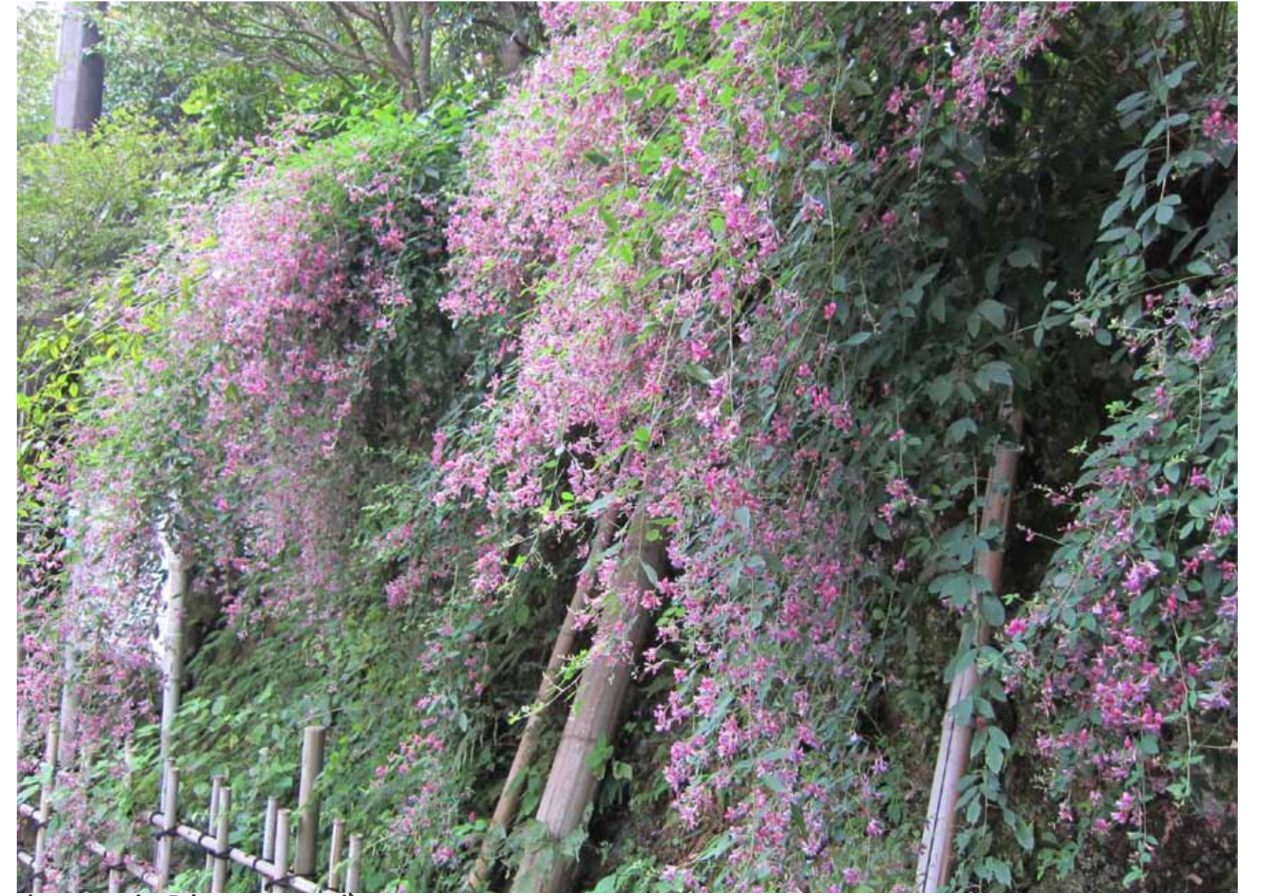
報国寺脇のハギ 10月