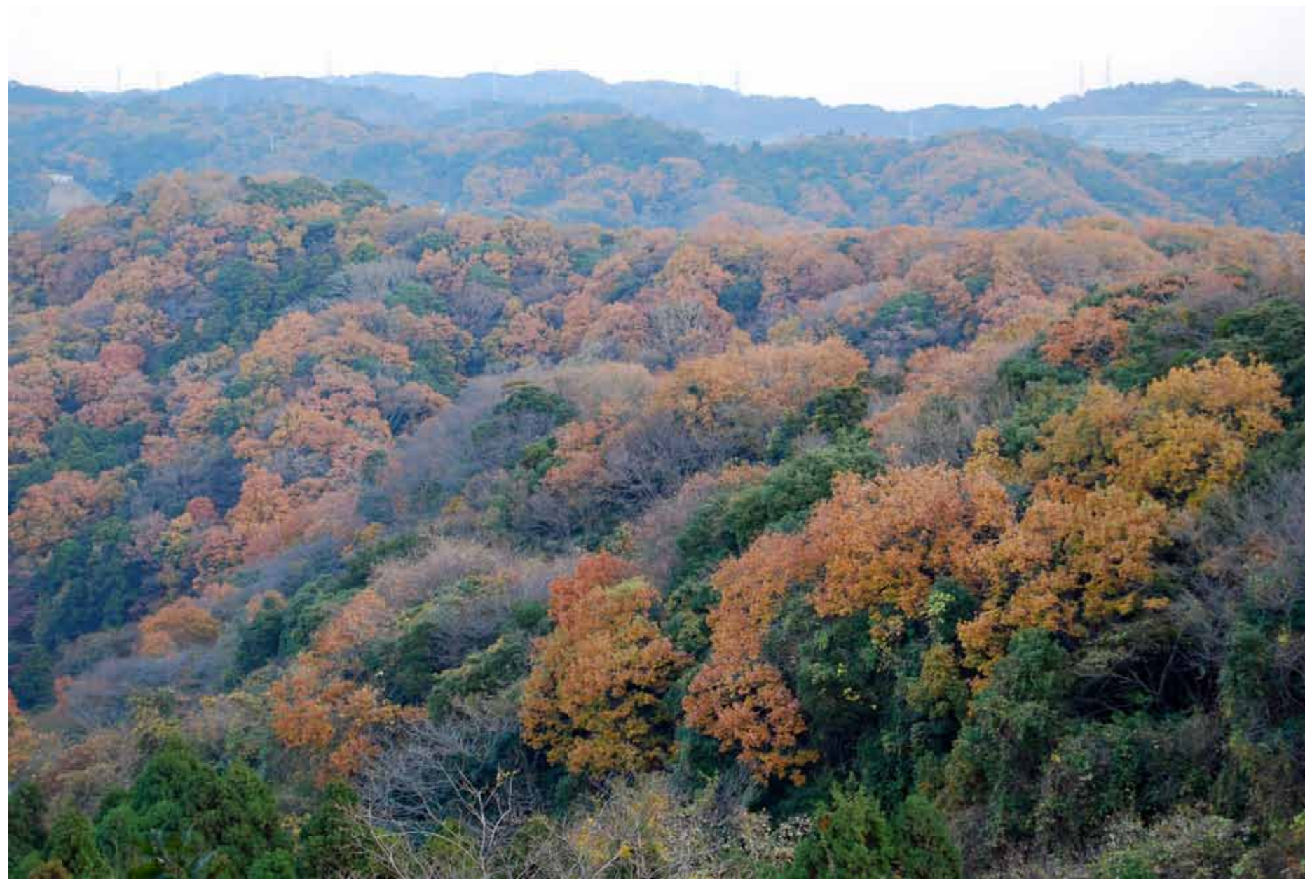
衣張山への道から巡礼古道方面を望む 12月