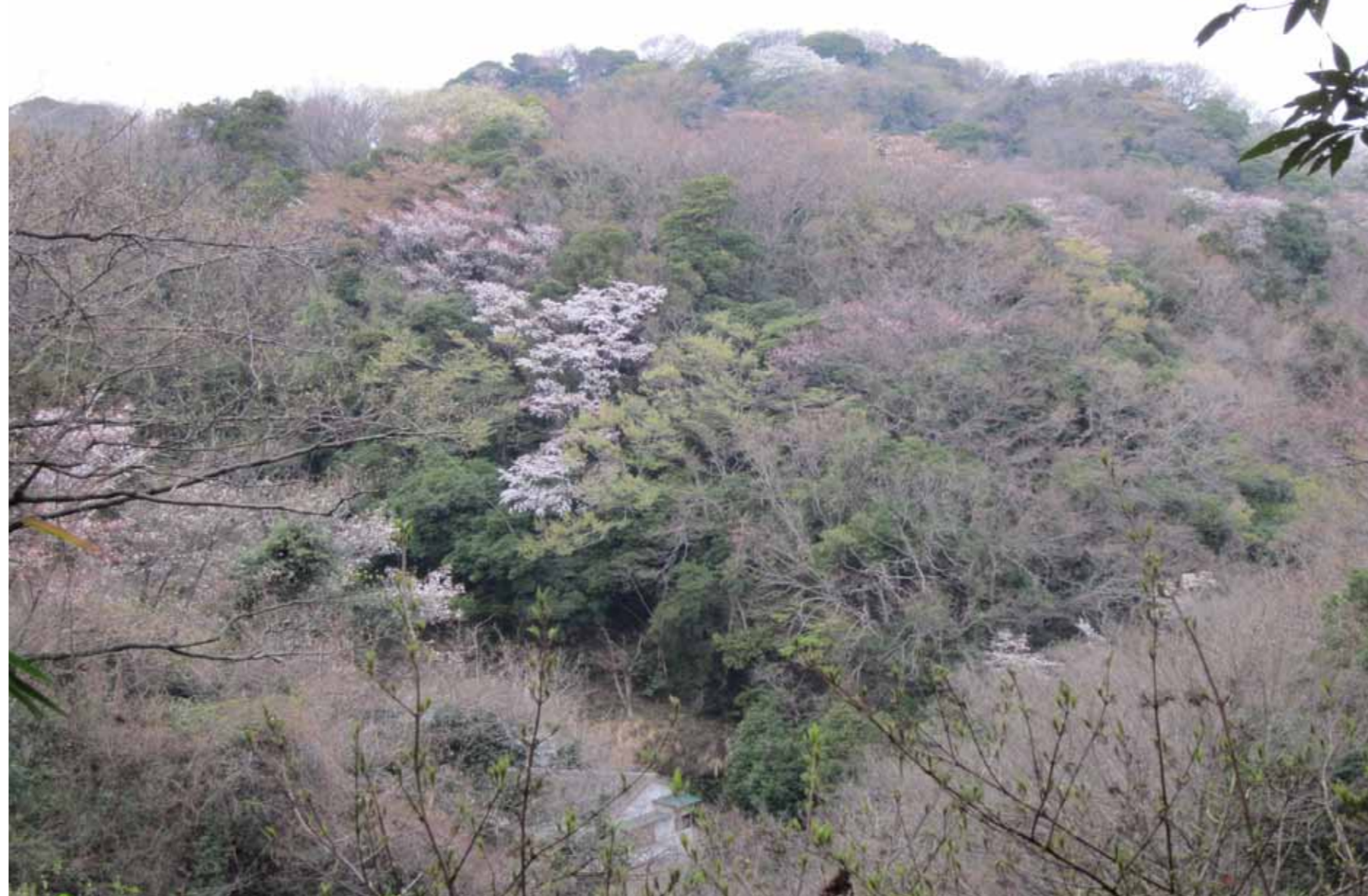
浄明寺緑地から衣張山方面を望む 3月